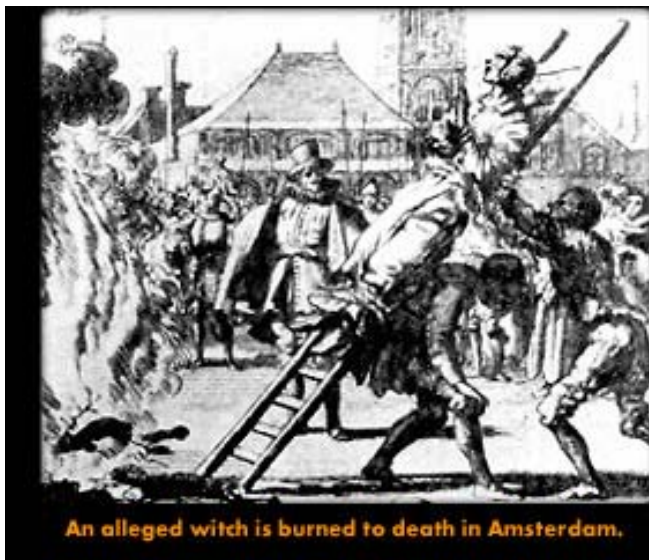
Abb. 2: Hexenjagd im Mittelalter http://www.parascope.com/en/articles/witches03.htm

Bei G. W. Bush weiss man, woran man ist, da der Eindruck den er in der Öffentlichkeit erzeugt, ganz seinem Denken und Handeln entspricht. Aber dies spielt im gegenwärtigen Amerika keine Rolle, da sich dort „ die meisten Menschen mit dem Schein genauso gut abspeisen lassen wie mit der Wirklichkeit “ wie Machiavelli betonte. Ist die Wiederwahl von Bush somit eine Katastrophe? Die Antwort lautet paradoxerweise Nein. Die meisten Amerikaner hätten ohne ihn nicht erkannt, was es heisst zu glauben, in einer Demokratie zu leben, die in Wahrheit jedoch eine Medien-Diktatur ist. „ Die öffentliche Meinung ist längst nicht mehr der geeignete Zensor “ wie dies Thomas Jefferson noch 1816 beschrieb, da diese heute nach Belieben, wie beispielsweise durch Fox-News, der „Prawda der Republikaner“, manipuliert wird. Anstatt die Systemfrage zu stellen, wird die politische Klasse von den Medien umgarnt. Jefferson's zeitloser Gedanke, dass jede Generation ihre Verfassung überprüfen und gegebenenfalls ändern muss (das US-Wahlsystem offenbart, dass dies heute in den USA zu einer politischen Notwendigkeit geworden ist), wird von den Medien konsequent ignoriert. G.W. Bush wird deshalb sein ehrgeizige Hexenjagd auf Andersdenkende und damit die Beerdigung des amerikanischen Traumes zu Ende bringen. Ironischerweise wurde George wiedergewählt, weil er für die Mehrheit der Amerikaner die Vision verkörpert, dass dieser Traum noch nicht ausgeträumt ist.