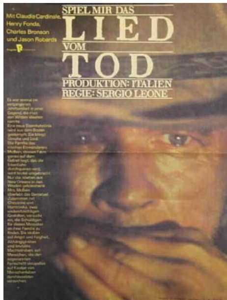
Abb. 4: Spiel mir das Lied vom Tod