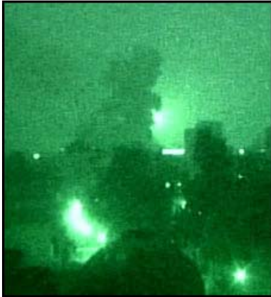
Abb. 5: Bomben auf Bagdad