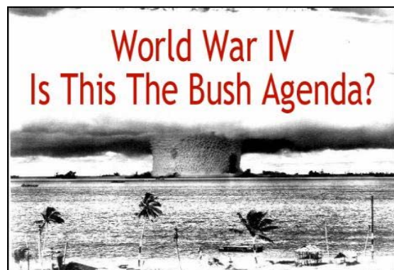
Abb. 3: Was ist Bush's Terminplan?