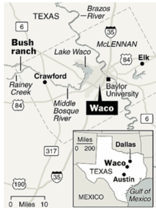
Abb. 5: Bush-Ranch in der Nähe von Crawford

seinen engsten Anhängern Cheney , Rumsfeld und Rice verbarrikadieren. Ob es ihm etwas nützen wird ist jedoch mehr als fraglich, schliesslich hat man im Land der unbegrenzten Möglichkeiten Erfahrungen im Legen von Feuern. God bless America!