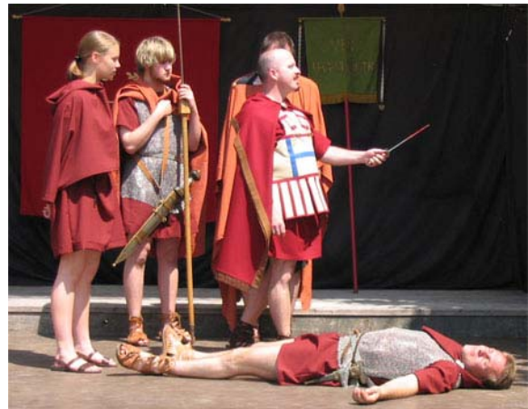
Abb. 1: Die Ermordung Julius Cäsars

ekelerender wäre als die Fortsetzung seiner unsäglichen Amtszeit.