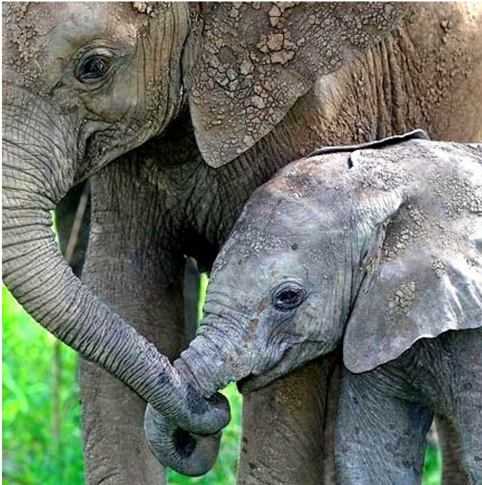
Abb. 2: Elefantenmutter mit Kind

Das kann bisher allein der Mensch im gesamten Kosmos – hindurchtönend (Person) sein. Und so einerseits aus der Evolution herausfallen und andererseits den “Punkt Omega“, den Zielpunkt der unendlichen Evolution des Kosmos, im Sprung vorwegnehmen. Im Drachensprung ins All hinauf. Achtzehn Monate ist der “elternfütternde Affe“ dabei typischerweise alt. Bald kann das nun auch ein Elefant – und ein virtueller Roboter namens “Avatar“, der eine Zeitreise in unsere Gegenwart gemacht hat. Lampsacus existiert ja auch schon in der Gegenwart, obwohl es erst aus der Zukunft finanziert wird. Auch dieses letztere – kleinere – Wunder ist eine Geste von Maya-Eywa, die bereits heute wirksam ist.