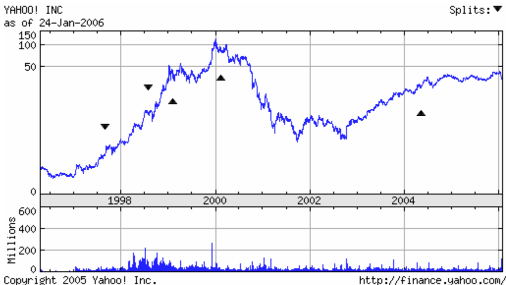
Abb. 1: Aktienkurs-Entwicklung von Yahoo! (Nasdaq: YHOO)

Déjà vu stammt aus dem französischen und bedeutet, dass man etwas schon mal gesehen hat. Aktuell beschleicht selbst abgebrühten Börsianern beim Aktienkurs von Google das unheimliche Gefühl, dass dem Kurs das gleiche Schicksal widerfahren könnte wie zuvor Yahoo! oder Amazon.com. Der Begriff Déjà vu stammt bekanntlich von Emile Boirac (1851-1917) und richtet unsere Aufmerksamkeit auf die Vergangenheit. Das Einzigartige am Déjà vu ist jedoch nicht die Vergangenheit, sondern die Gegenwart und in dieser könnte der Google-Kurs in kürzester Zeit erodieren wie zu den Zeiten als wir den Internet-Bubble im Rahmen von Millisekundenpleiten ( http://www.heise.de/bin/tp/issue/r4/dl-artikel2.cgi?artikelnr=8899&mode=print ) bei vielen Werten platzen sahen.