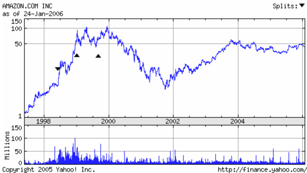
Abb. 2: Aktienkurs-Entwicklung von Amazon.com (Nasdaq: AMZN)

damals innerhalb weniger Wochen auf neue Rekordstände von 600 USD trieb, dass man die Aktie unbedingt verkaufen müsse. Der Mann muss es wissen, empfahl er doch seinen Kunden Amazon.com zum Kauf, während er seinen Kollegen sagte, dass diese völlig überbewertet sei. Doch bei Google dürfte der ehemalige Berufslügner Blodget recht behalten. Mittlerweile wird Google etwa 300 bis 350 US-Dollar über einem fairen Marktwert gehandelt. Zwar konnten im letzten Quartal die Umsätze weiter kräftig zulegen, jedoch scheinen bei Google die Kosten ausser Kontrolle zu geraten.