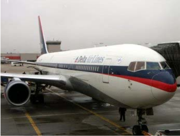
Abb. 3: Boeing 767; Quelle: www.delta.com

puren Luxus bezeichnen. Zwar schätzen Experten den Kaufpreis auf unter 20 Millionen US-Dollar (der Neupreis liegt bei etwa 140 Millionen US-Dollar), trotzdem scheint bei den Google-Gründern, deren Vermögen auf mittlerweile 22 Milliarden US-Dollar ( http://www.forbes.com/lists/2005/54/D664.html ) geschätzt wird, die Gigantomie ausgebrochen zu sein.