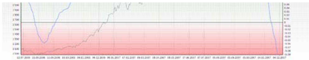
Chinesischer Aktien-Bubble A-Aktien: graue Kurve: Index; blaue Kurve: Livermore-Indikator. Grafik: Unternehmercockpit (1)