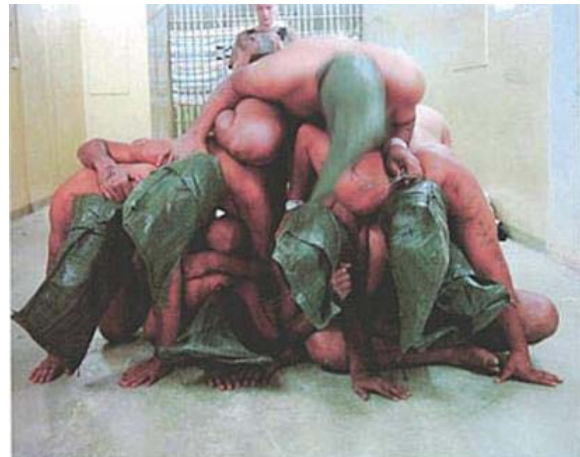
Abb. 4: Abu Ghraib: Gefangenen-Folter im Irak