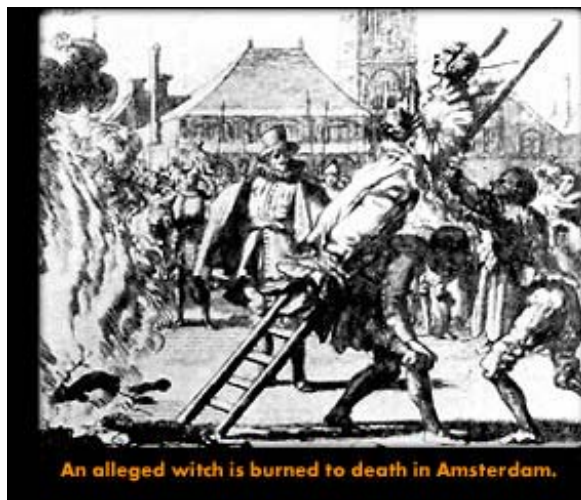
Abb. 5: Hexenjagd im Mittelalter

die Mehrheit der Amerikaner die Vision verkörpert, dass dieser Traum noch nicht ausgeträumt ist.