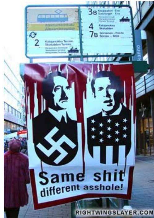
Abb. 6: Wahlkampf gegen die Gleichschaltung

Michael Moore kann weitere Gründe aufzählen, warum es nicht lohnenswert gewesen wäre, sich damals im Jahr 2004 die Pulsadern aufzuschneiden.