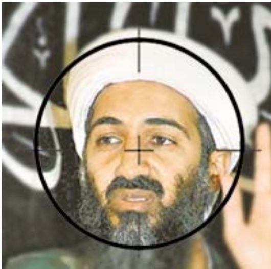
Abb. 7: Bush-Lizenz zum Töten von Bin Laden

während seiner zweiten Präsidentschaft sinnigerweise George Clinton (allerdings ein Republikaner) hiess, hätte den dann nach 8 Jahren sowieso unumgänglichen Walk Out für George Walker besser zu Papier bringen können: "The spirit of resistance to government is so valuable on certain occasions, that I wish it to be always kept alive. It will often be exercised when wrong, but better so than not to be exercised at all. I like a little rebellion now and then. It is like a storm in the atmosphere."