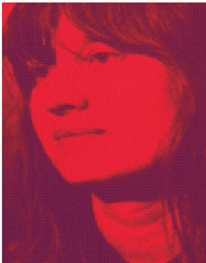
Abb. 2: Staatsfeind Nr. 1 Ulrike Meinhof

Trauma überwunden und Ulrike Meinhof , der wie in Friedrich Schiller 's Stück "Die Räuber" tatsächlich oder vermeintlich von Autoritäten Unrecht zugefügt wurde, darf wieder in das deutsche Mutterherz aufgenommen werden. Für den roten Amerikaner ist eben auch der nicht mehr so ganz rote Gerhard Schröder , wenn er nicht für den Irak ist, ein Terrorist, ebenso wie diejenigen, die in den 70er Jahren die Bundesrepublik Deutschland in Angst und Schrecken versetzten: Welcome in the Terrorist Club, Gerhard!