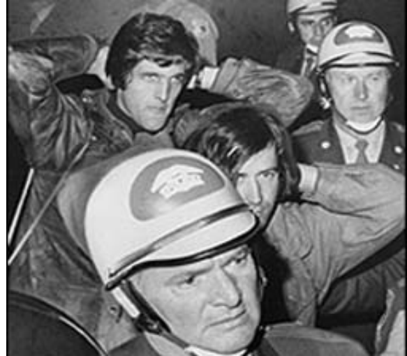
Abb. 1: Rechte Propaganda gegen Kerry

Jedes Land bekommt den Präsidenten den es verdient. Wenn nahezu 60 Millionen US-Bürger eine Person wählen, die sich in den letzten 4 Jahren als Arschloch geoutet hat, dann ist der A-Quotient dieser Majorität, wie Charles Lewinsky es ausgedrückt hätte, besonders hoch. Das Land der unbegrenzten Möglichkeiten ist in den letzten vier Jahren in den Augen der Mehrheit der Weltbevölkerung zum Land der unbegrenzten Arschlochizität aufgestiegen. Lewinsky's These, dass die Arschlöcher immer in der Mehrheit sind, wurde jetzt durch den US-Wähler eindrücklich bestätigt. Doch was lehrt uns dieser Wink mit dem braunen republikanischen Zeigefinger für die abgeschlagenen Demokraten. Setze in einer Schmiergeld- und Lobbyisten-Plutokratie nie auf das falsche Pferd, wenn Du eine Wahl gewinnen willst. Die Zäumung von John F. Kerry war bereits gerissen, als dieser zunächst für und danach wieder gegen den Irak-Krieg plädierte. Umfallen darf man in den USA nicht, wenn man Wahlen gewinnen will. Man darf zwar viele Geliebte haben und sich gegebenenfalls unterhalb des Tisches im Oval Office einen blasen lassen, aber zumindest sass William Jefferson Clinton bei diesem Entertainment wohl noch relativ aufrecht am Schreibtisch. Der Umgefallene liegt jedoch am Boden, ist wehrlos und wurde, wie bei Kerry erfolgt, von der rechten Bush-Propaganda vergewaltigt, wie zuvor die Grundrechte, die mit einem juristischen Heldenlied, dem Patriot Act, zu Grabe getragen wurden.