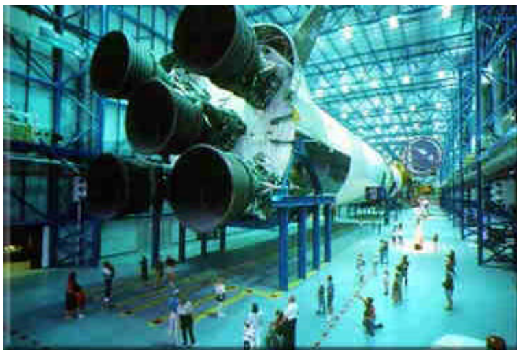
Saturn V im Kennedy Space Center

H.-H. Koelle: Die ersten Roboter haben ja bereits als Raumsonden das Sonnensystem verlassen. Das wird wohl auf absehbare Zeit so bleiben, aber die Roboter werden größer und leistungsfähiger werden.