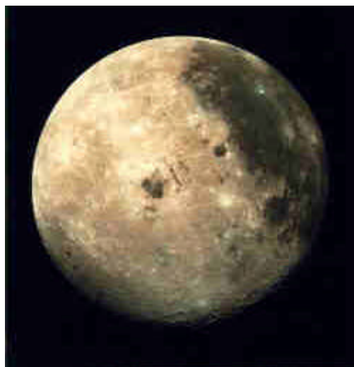
Der Mond.

▶ An welchen Projekten arbeiten Sie aktuell?