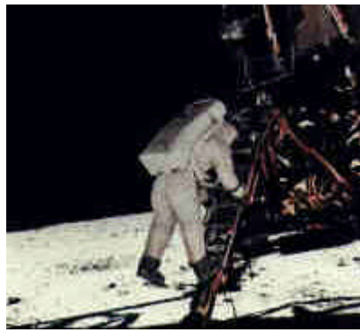
Aldrin betritt den Mond bei der ersten Apollo-Landung.

H.-H. Koelle: Eine große Rolle. Hier ist Neuland, das noch beackert werden kann. Ich kann mir durchaus vorstellen, daß es in absehbarer Zeit möglich sein wird, mit elektronischen Hilfsmitteln die benachbarten Himmelskörper zu besuchen und zu erkunden.