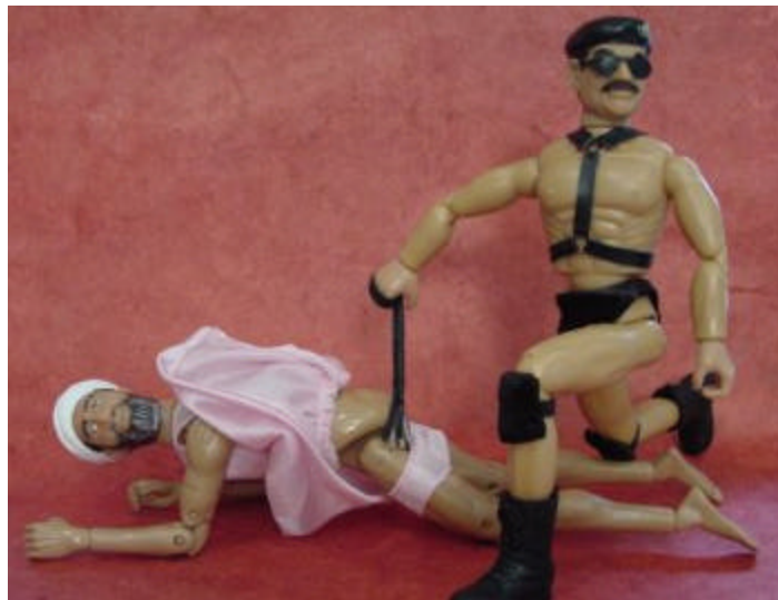
Ein Vorschlag von Hero Building, die Puppen aufzustellen

Das fanden offenbar nicht alle nur lustig, wie die Hate Mails zeigen, aber mittlerweile gibt es noch weitere Kostüme. Gezeigt wird natürlich nur die "offizielle" amerikanische Version: Bush standardmäßig in Kampfanzug oder in T-Shirt mit einem Osama-Wanted-Poster bzw. einer "Präsidentenkleidung", Osama als Tunte in rosa Frauenkleidern oder Hussein in Sado-Maso-Ausstattung. Das gibt möglicherweise einen tiefen Blick in manche amerikanische Seele. Doch die Bekleidung ließe sich natürlich auch austauschen: mit Bush als Tunte oder Blair als SM-Adept.