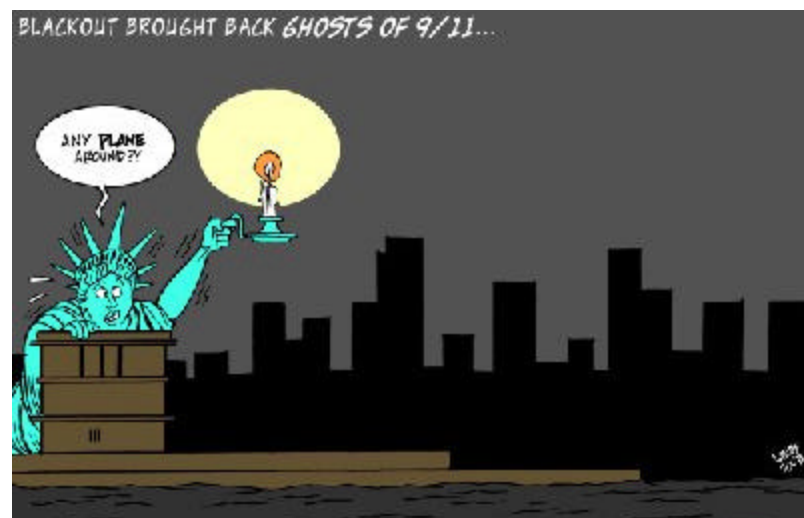
Any Plane Around? Der brasilianische Karikaturist Latuf reagierte schnell

In New York wurden nach Medienberichten Bürogebäude evakuiert und gingen Hunderttausende auf die Straßen. Fahrstühle, U-Bahnen und Züge steckten fest, Ampeln gingen nicht mehr, der Verkehr stand