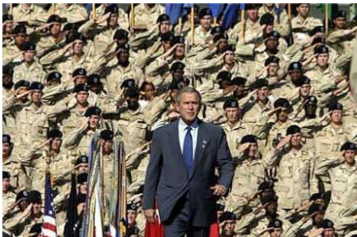
US-Präsident vor seiner Rede: Als oberster Befehlshaber sieht sich Bush am liebsten in der Öffentlichkeit

Dass die Bush-Regierung den 11.9. für eigene Zwecke und den Machterhalt gnadenlos ausgebeutet hat und noch immer ausschlachtet, ist bekannt und wurde schon vielfach kritisiert. Dass sie offensichtliche Falschmeldungen nicht zurücknimmt und möglicherweise auf die durch die eigenen Reaktionen selbsterfüllende Prophezeiung erwartet, wurde im Fall des Irak-Kriegs mehr als deutlich. Nach Umfragen glauben mehr als die Hälfte der Amerikaner noch an die Regierungspropaganda, dass Hussein irgendwie mit dem 11.9. verbunden ist oder dass der Irak irgendwie mit al-Qaida zusammen gearbeitet hatte. Allerdings wurde der Irak erst nach dem Krieg zu einer Terrorhochburg, der Krieg und die wenig glückliche Besatzung stärken zudem im Land selbst und weltweit den muslimischen Terrorismus.