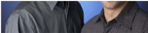
Google-Gründer und –Präsidenten Lawrence Page und Sergey Brin: Our informal corporate motto is "Don't be evil."

Es ist deshalb von entscheidender Bedeutung, den Umfang von Insider-Transaktionen ausgiebig zu studieren. Wenn Insider die Aktien ihres eigenen Unternehmens kaufen, dann ist anzunehmen, dass diese mehr wissen als der normale Anleger. Die Gründe hierfür können ein hohes Wachstumspotential, ein Merger, ein Zukauf oder die Unterbewertung einer Aktie sein. Wenn ein Insider eine Aktie kauft, dann erwartet er einen zukünftigen Preisanstieg.