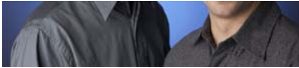
Google-Gründer und –Präsidenten Lawrence Page und Sergey Brin: Our informal corporate motto is "Don't be evil."

Es ist deshalb von entscheidender Bedeutung, den Umfang von Insider-Transaktionen ausgiebig zu studieren. Wenn Insider die Aktien ihres eigenen Unternehmens kaufen, dann ist anzunehmen, dass diese mehr wissen als der normale Anleger. Die Gründe hierfür können ein hohes Wachstumspotential, ein Merger, ein Zukauf oder die Unterbewertung einer Aktie sein. Wenn ein Insider eine Aktie kauft, dann erwartet er einen zukünftigen Preisanstieg.