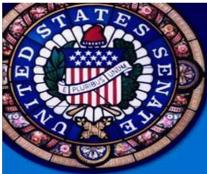
Der US-Senat: E Pluribus Unum - "Out of many, one who knows the right stock."

Doch darf man den US-Senatoren vorwerfen, dass sie in ihre eigene Tasche wirtschaften, wenn doch jeder US-Wähler vor allem die Partei wählt, die ihm sein Portemonnaie fühlt?