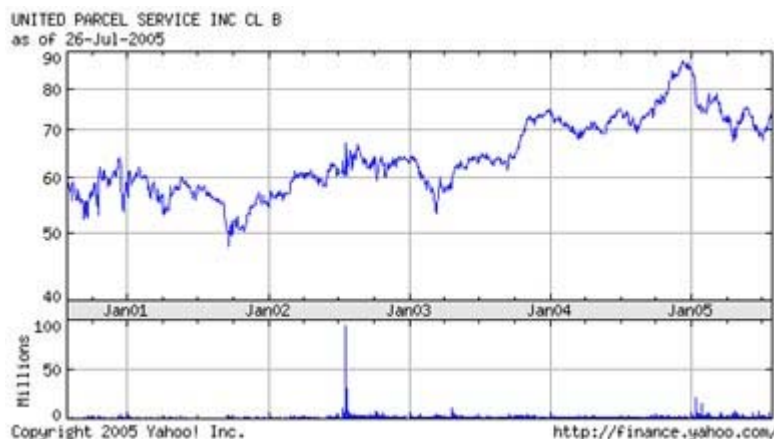
Kursanstieg von UPS nach dem Jahr 2003

Eine weitere interessante Beobachtung der Studie ist, dass die jüngeren Senatoren die älteren bei den Kursgewinnen hinter sich ließen und dass die demokratischen Anleger bei den Renditen gegenüber ihren republikanischen Tradern, wenn auch nur leicht, vorn lagen. Der demokratische Präsidentschaftskandidat John Kerry ist ein besonders trading-orientierter Senator, wie ein Blick auf seine Portfoliostruktur (4) aus dem Jahr 2003 erkennen lässt. Der Chart von United Parcel Service belegt die großen Kursgewinne, die US-Senator Kerry nach seinem Einstieg erzielen konnte.